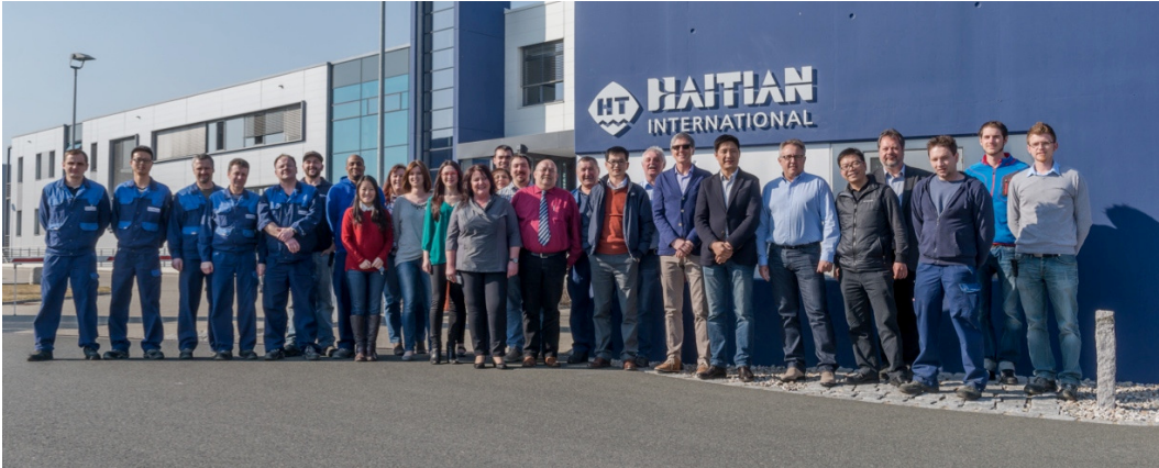
Das Team von Haitian International Germany vor dem Firmengebäude in Ebermannsdorf